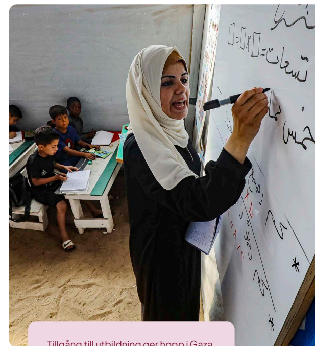
Tillgång till utbildning ger hopp i Gaza.

Mer hjälp när fram till barn i krissituationer, och fler åtgärder sätts in tidigt för att motverka de värsta konsekvenserna av naturkatastrofer. Långsiktiga återhämtnings- och återuppbyggnadsinsatser bidrar dessutom till stärkt motståndskraft över tid.