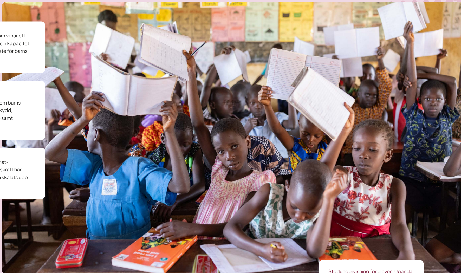
Stödundervisning för elever i Uganda.

Flera innovativa lösningar för klimat-anpassning och barns motståndskraft har implementerats, visat effekt och skalats upp genom våra partnerskap.