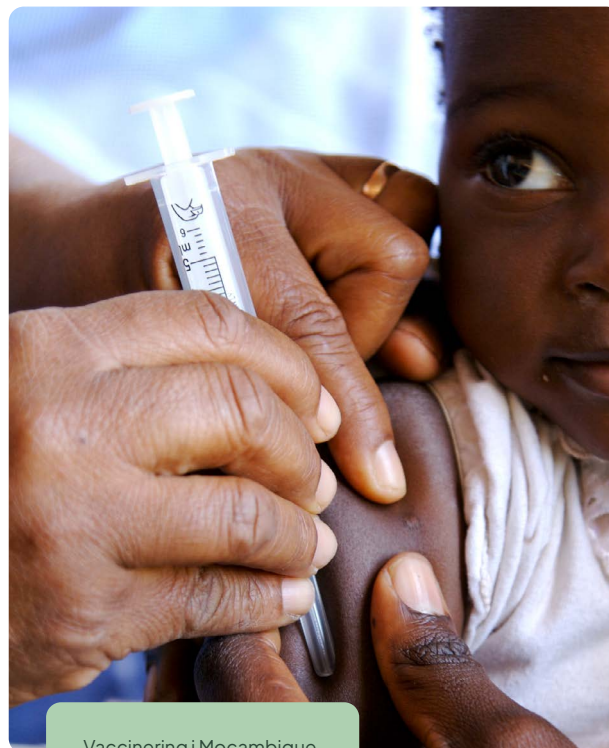
Vaccinering i Moçambique.

Som en del av ChildFund Alliance samarbetar Barnfonden med andra medlemsorganisationer i nätverket och stöttar deras arbete. Men vårt fokus ligger i första hand på lokala organisationer som genomför insatser för barns rättigheter. Vi strävar efter långsiktiga partnerskap men är också öppna för nya samarbeten som kan hjälpa oss att nå fler barn eller att utveckla nya och mer effektiva arbetssätt.