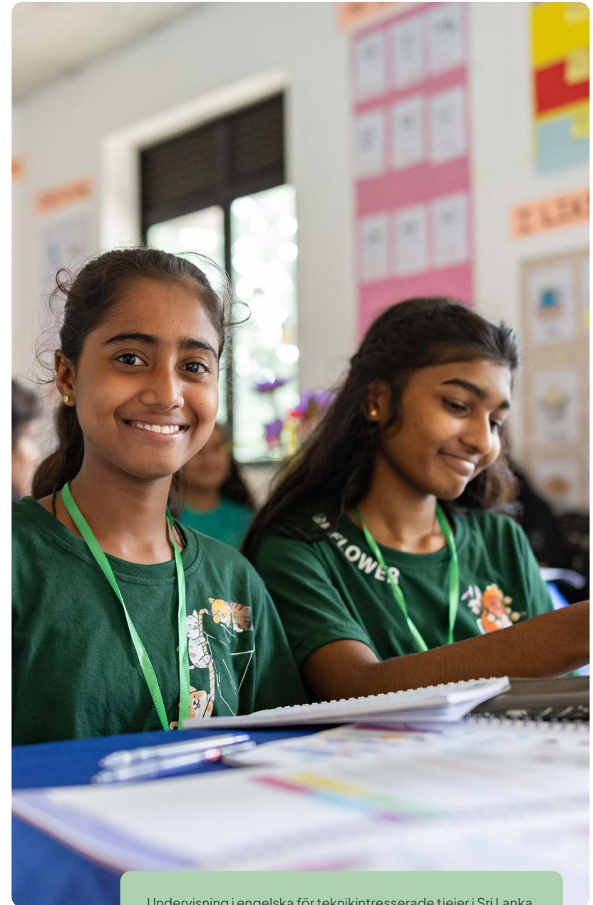
Undervisning i engelska för teknikintresserade tjejer i Sri Lanka.

Strategin 2026–2030 är Barnfondens riktning för hur vi stärker barns rättigheter i en tid av ökande globala risker. Genom lokalt ägarskap, långsiktiga partnerskap, klimatanpassat utvecklingsarbete och mod att förändras skapar vi hållbara resultat för barn – idag och för kommande generationer.