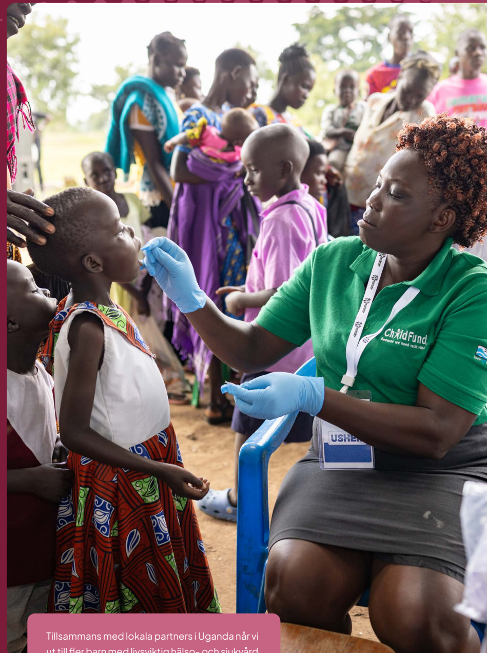
Tillsammans med lokala partners i Uganda når vi ut till fler barn med livsviktig hälso- och sjukvård.

Mål: Öka det effektiva och effektfulla stödet till lokala samarbetspartners som arbetar för barns rättigheter i både humanitära- och utvecklingskontexter genom kapacitetsutveckling, finansiering, partnerskap och innovativa samarbeten.