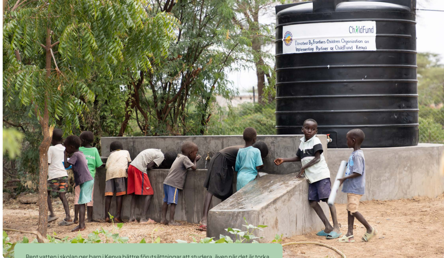
Rent vatten i skolan ger barn i Kenya bättre förutsättningar att studera, även när det är torra.

Genom strategiska partnerskap och nätverk ökar vi vår genomslagskraft, utbyter kunskap och resurser och skapar resultat större än summan av delarna. Vi är en tydlig och aktiv röst; bygger partnerskap som stärker vår kunskap, finansiering och påverkan, och säkerställer att all medverkan är resultatriktad och strategiskt kopplad. Som aktiv medlem i ChildFund Alliance bidrar vi målmedvetet till att stärka nätverket och tar ansvar i linje med vårt uppdrag och våra mål.