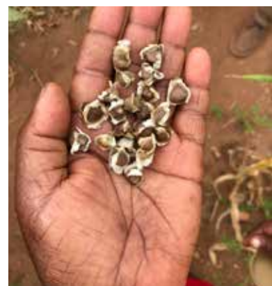
Plantering av moringaträd i Kenya.

I programländerna arbetar vi och våra partners utifrån ett helhetsperspektiv. För att skapa hållbar utveckling krävs flera långsiktiga insatser som pågår parallellt. Till exempel så kan en satsning på att öka antalet barn som går i skolan inte lyckas om vi inte samtidigt arbetar på andra fronter. Det krävs att föräldrarna förstår vikten av undervisning och att de har råd att låta sina barn gå i skolan. Barnen kommer inte heller att kunna tillgodogöra sig undervisningen om de är undernärda eller sjuka i till exempel malaria eller vattenburna sjukdomar som diarré. Barnfonden stödjer som regel aldrig isolerade projekt i programländerna, utan alla insatser är knutna till större utvecklingsprogram. När vi börjar arbeta i ett nytt område görs ett långsiktigt åtagande för att stärka de boende genom bland annat utbildning och kompetensutveckling. Vi vill