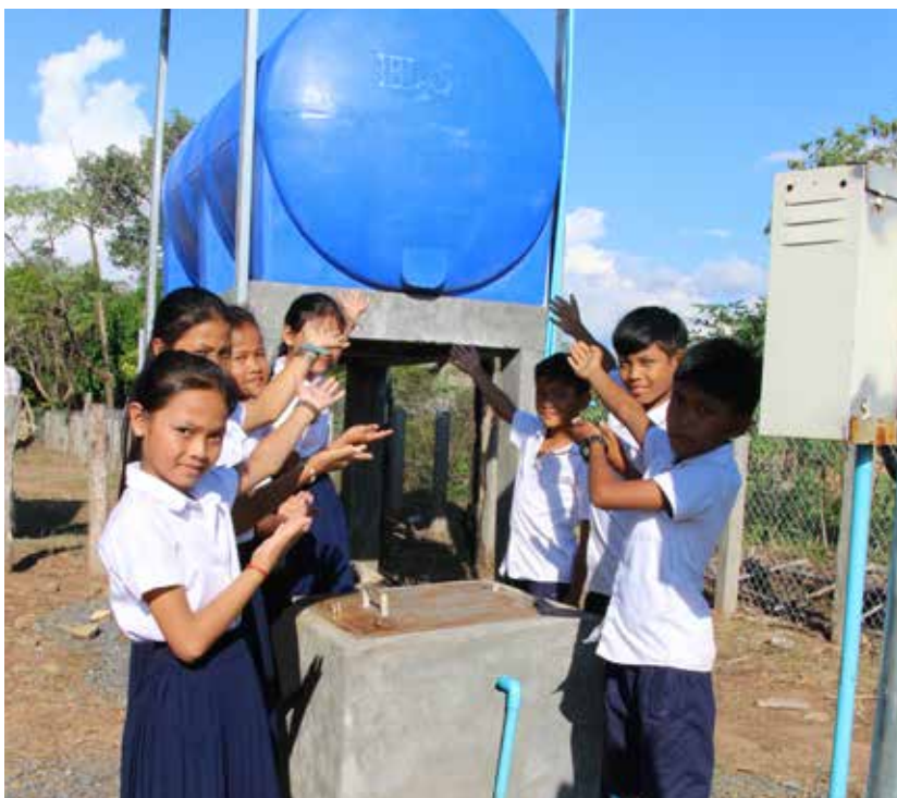
Rent vatten till skolbarn och byar i Kambodja.