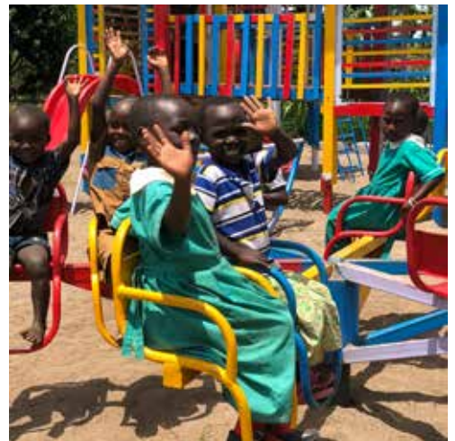
Barnvänliga förskolor och skolor.