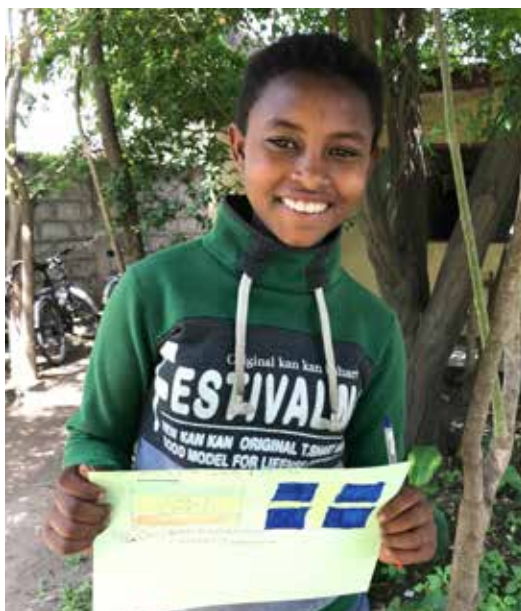
Fadderskap som ger 20 000 faddrar i Sverige möjlighet att kommunicera med barn och familjer i andra delar av världen.

skapa verklig och hållbar förändring i området och en förutsättning för att det ska lyckas är familjernas vilja att delta i planering och utförande av arbetet i projekten. På sikt är tanken att byar och samhällen helt ska kunna överta arbetet i egen regi. Vi arbetar även aktivt för att barn och ungdomar själva ska vara viktiga aktörer och pådrivare i förändringsarbetet och ta ansvar i frågor som rör dem och deras omgivning. Det här sättet att arbeta underlättar för långsiktig hållbarhet då det bygger relationer och skapar ett ömsesidigt förtroende. Utvecklingsarbetet vinner legitimitet både hos lokala myndigheter och organisationer och hos framtidens beslutfattare - barnen.