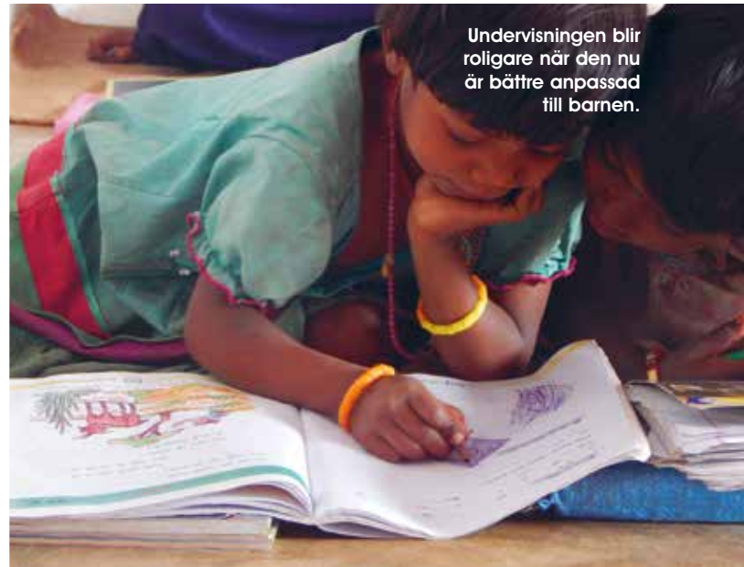
Undervisningen blir roligare när den nu är bättre anpassad till barnen.