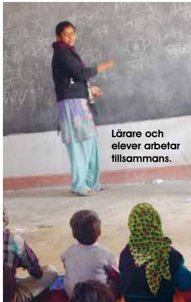
Lärare och elever arbetar tillsammans.