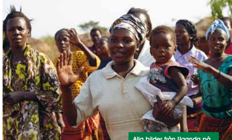
"Att fota är en av mina hobbyer. Men det är svårt att ta bilder på en sådan här resa, det är så intensivt och så mycket som händer."