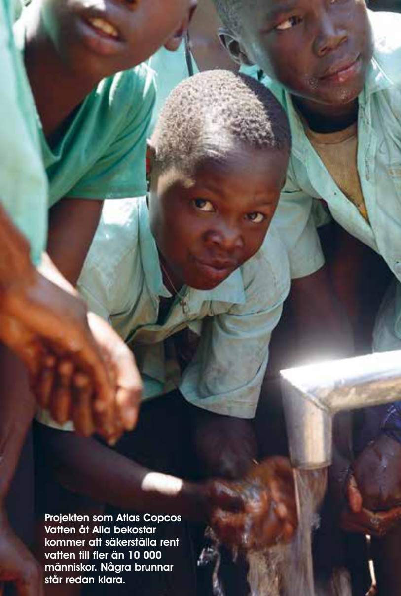
Projekten som Atlas Copcos Vatten åt Alla bekostar kommer att säkerställa rent vatten till fler än 10 000 människor. Några brunnar står redan klara.