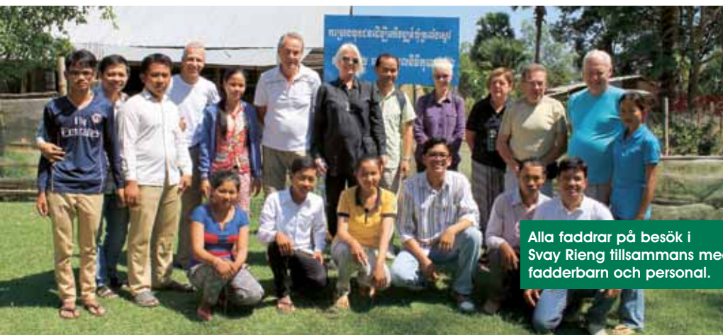
Alla faddrar på besök i Svay Rieng tillsammans med fadderbarn och personal.