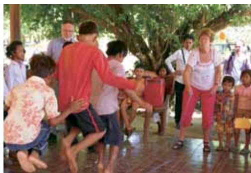
Ulla hade tagit med sig ett hopprep som snabbt gjorde succé!