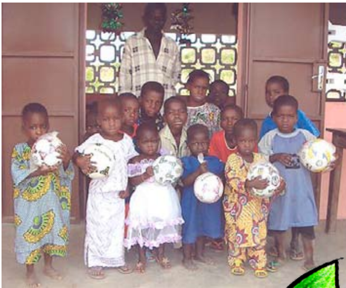
En julgåva till projektet Tamaa i Benin användes till att köpa fotbollar till barnen.

Många faddrar har upptäckt glädjen i att skänka en gåva till fadderbarnets projekt vid jul. Julgåvan används vanligtvis till en fest för alla barn i projektet eller till julklappar till barn som inte fått någon julgåva.