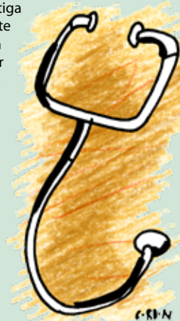
Illustration: MATTIAS GORDON

På vår hemsida kan du läsa om fler sjukdomar. www.barnfonden.se/sjukdomar