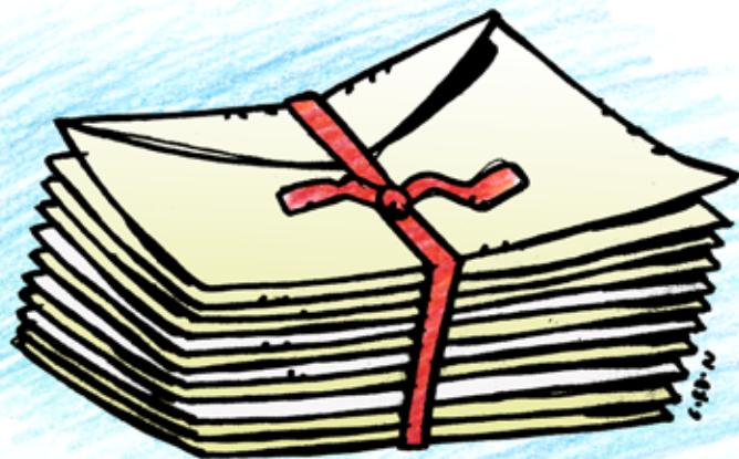
Illustration: MATTIAS GORDON