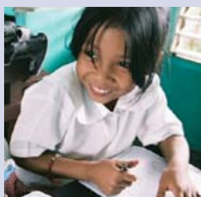
Skolan blir roligare när barnen själva får vara med och bestämma.

Genom Framtidsfonden är Barnfonden just nu med och stödjer arbetet för att skapa barnvänliga skolor i Filippinerna, Bolivia och Ecuador.