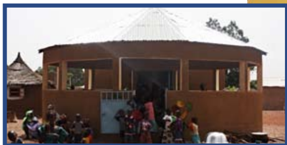
Ett barncentrum kommer snart att byggas i Faridié.

Tack vare många generösa gåvor har nu arbetet med att bygga ett barncentrum i Faridié påbörjats. Men för att även byarna Bélécou och Kossa ska få barncentrum behövs fler gåvor.