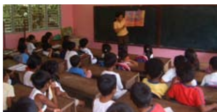
Med spännande och pedagogiskt skolmaterial ökar barnens engagemang.