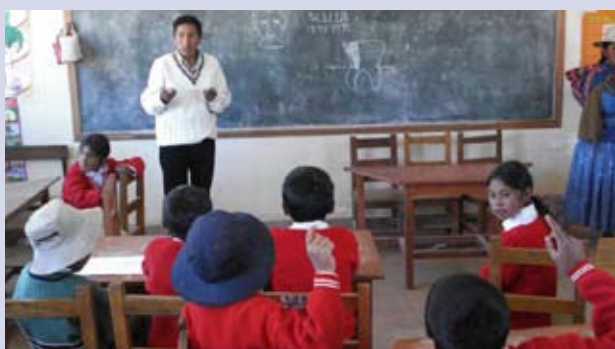
Aktiva barn på lektion i Bolivia.