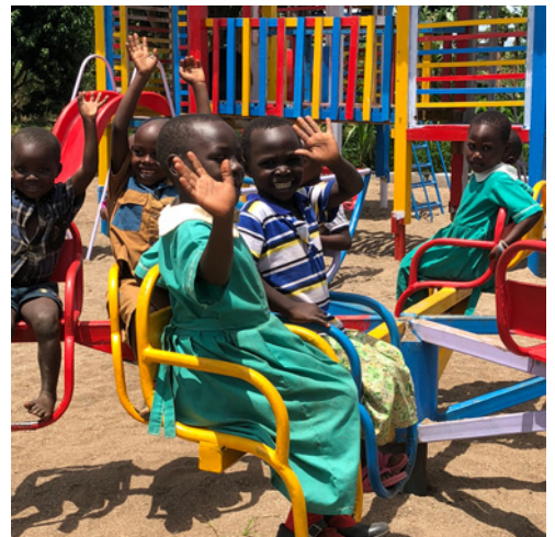
Barnvänliga förskolor och skolor.