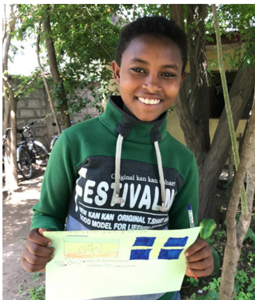
Fadderskap som ger 20 000 faddrar i Sverige möjlighet att kommunicera med barn och familjer i andra delar av världen.

skapa verklig och hållbar förändring i området och en förutsättning för att det ska lyckas är familjernas vilja att delta i planering och utförande av arbetet i projekten. På sikt är tanken att byar och samhällen helt ska kunna överta arbetet i egen regi. Vi arbetar även aktivt för att barn och ungdomar själva ska vara viktiga aktörer och pådrivare i förändringsarbetet och ta ansvar i frågor som rör dem och deras omgivning. Det här sättet att arbeta underlättar för långsiktig hållbarhet då det bygger relationer och skapar ett ömsesidigt förtroende. Utvecklingsarbetet vinner legitimitet både hos lokala myndigheter och organisationer och hos framtidens beslutfattare - barnen.