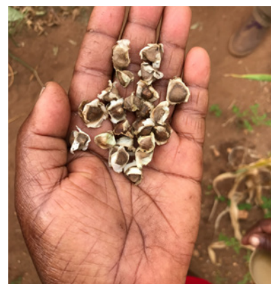
Plantering av moringaträd i Kenya.

I programländerna arbetar vi och våra partners utifrån ett helhetsperspektiv. För att skapa hållbar utveckling krävs flera långsiktiga insatser som pågår parallellt. Till exempel så kan en satsning på att öka antalet barn som går i skolan inte lyckas om vi inte samtidigt arbetar på andra fronter. Det krävs att föräldrarna förstår vikten av undervisning och att de har råd att låta sina barn gå i skolan. Barnen kommer inte heller att kunna tillgodogöra sig undervisningen om de är undernärda eller sjuka i till exempel malaria eller vattenburna sjukdomar som diarré. Barnfonden stödjer som regel aldrig isolerade projekt i programländerna, utan alla insatser är knutna till större utvecklingsprogram. När vi börjar arbeta i ett nytt område görs ett långsiktigt åtagande för att stärka de boende genom bland annat utbildning och kompetensutveckling. Vi vill