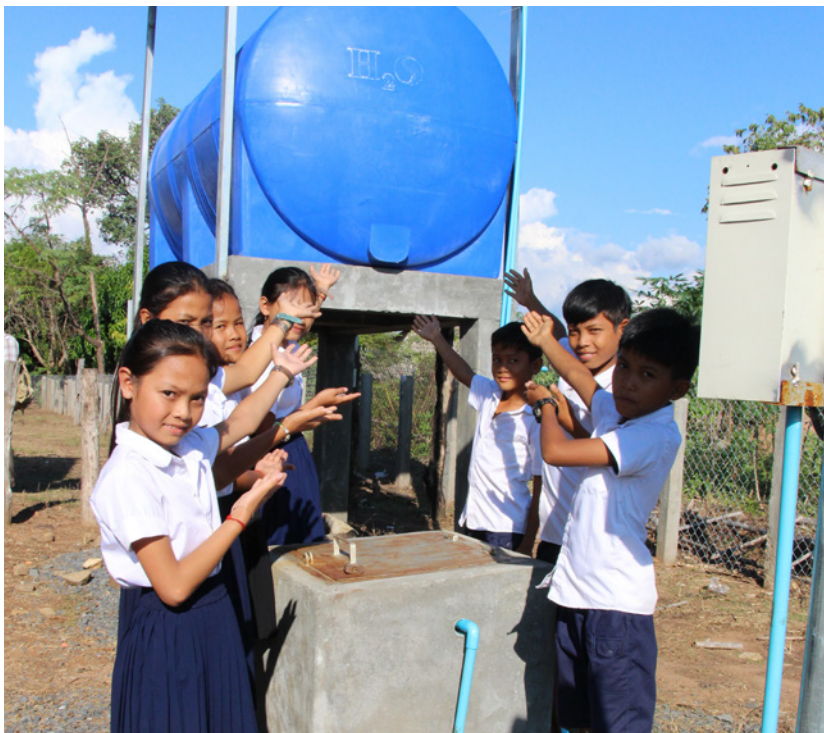
Rent vatten till skolbarn och byar i Kambodja.